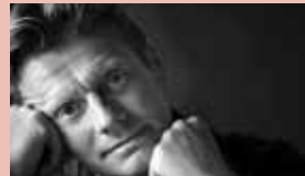
Edward Gal, ruiter