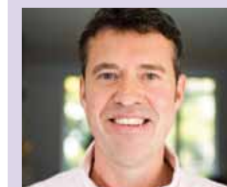
Functie: Voorzitter COC, www.coc.nl Leeftijd: 50