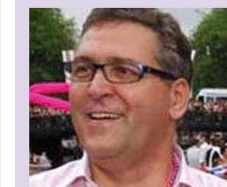
Functie: Hoofdredacteur Gaykrant, www.gk.nl Leeftijd: 59