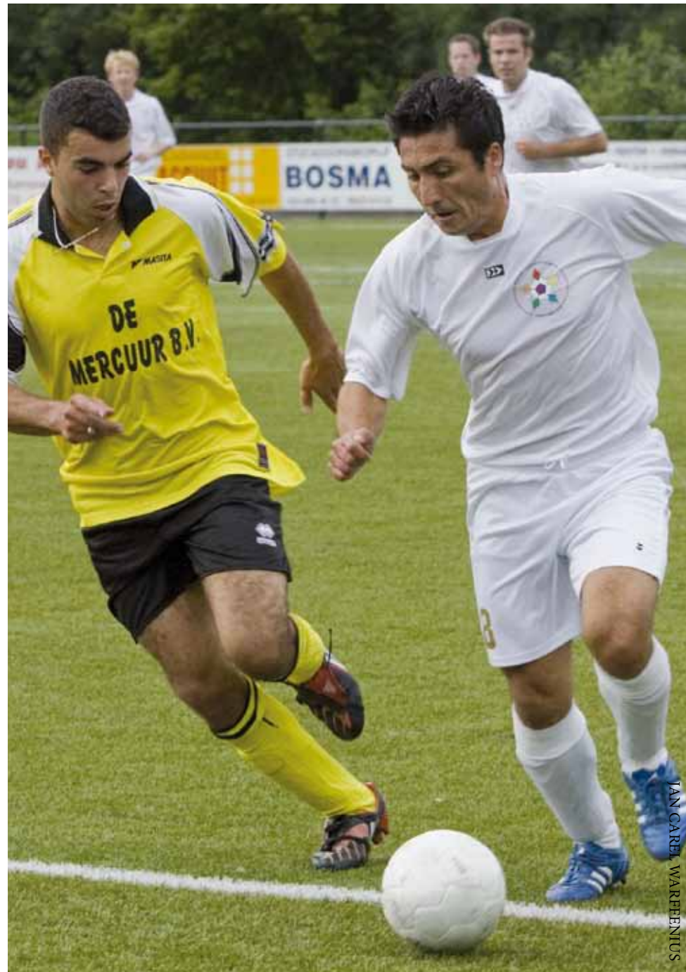
Afgelopen zomer voetballen moslims, niet-moslims en homo's tegen elkaar in Slotervaart, Amsterdam.

Daarom zijn homo's en lesbiennes in de sport relatief gesloten over hun seksuele voorkeur en vermijden ze bepaalde sporten. Onder homomannen zijn vooral mannelijke teamsporten als voetbal, volleybal en hockey populair. Zij doen liever aan fitness, zwemmen of tennis. Daar hopen ze minder in aanraking te komen met homonegatief gedrag. Lesbiennes ervaren dit probleem iets minder.