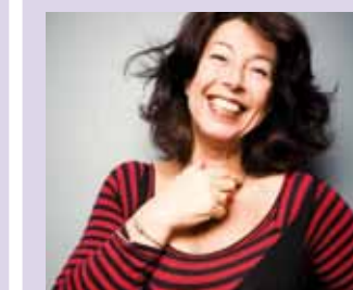
Functie: Uitgeefster Zij aan Zij, www.zijaanzij.nl Leeftijd: 50