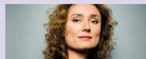
Functie: Vicevoorzitter COC Leeftijd: 38