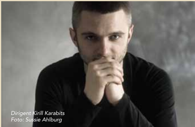
Dirigent Kirill Karabits

Voor de pauze een briljante vertolking van het derde pianoconcert van Rachmaninov. Tot voor kort kende ik alleen het tweede. In de afgelopen tijd heb ik in De Doelen ook concert 1, 3 en 4 leren kennen. Ze hebben allemaal die meeslepende lyriek die vanuit de tenen komt. Rachmaninov was een minstens zo kundig concertpianist als componist. Zijn derde pianoconcert, dat hij in 1909 componeerde en vooral