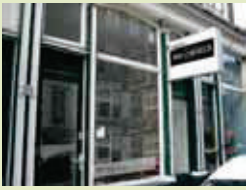
Galerie Iris Cornelis www.iriscornelis.com do + zo 11.00 - 14.00

Speciaal voor tijdens de Eurogames is een Kunstroute samengesteld langs galeries, musea en andere leuke plekjes. Je kunt een z-card met deze route vinden op verschillende plekken in de stad, zoals bij het COC Rotterdam en bij de Bibliotheek. Pak op en wandelen dus!