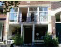
Galerie Hommes www.hommes.nl do: 12.00, vr: 15.00

Champagne ontbijt op donderdag en zaterdag ochtend voor € 22,50. Registreren en informatie via: kunstroute@eurogames2011.eu