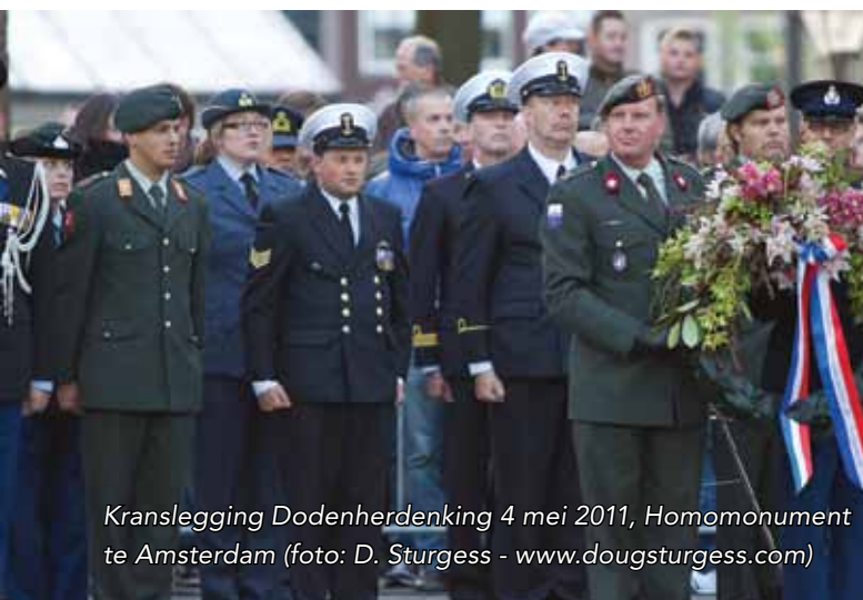
Kranslegging Dodenherdenking 4 mei 2011, Homomonument te Amsterdam

De SHK biedt ondersteuning en advies aan GLBTs en zet zich in voor homo-emancipatie binnen het Ministerie van Defensie. Uiteraard is het tegengaan van discriminatie en ongewenst gedrag ten aanzien van GLBTs, zowel militair als burger, een van de belangrijkste aandachtspunten. De stichting werkt met netwerkers en vrijwilligers en streeft