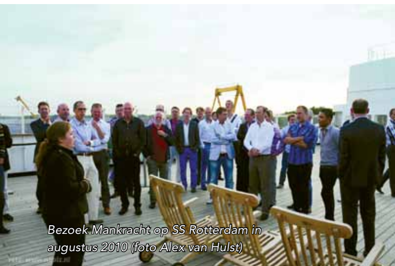
Bezoek Mankracht op SS Rotterdam in augustus 2010