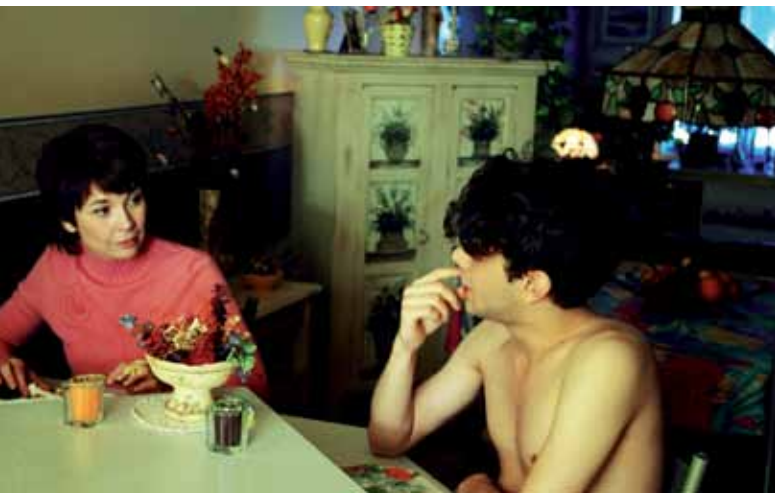
Still uit de film J'ai tuè ma mère

De film gaat over de 17-jarige Hubert die bijna constant overhoop ligt met zijn moeder. Dat blijkt uit de nodige scheldpartijen over en weer en het is voor beiden moeilijk om de warme