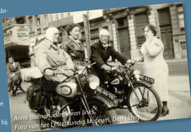
Anna Blaman, derde van links

Anna Blaman is het pseudoniem van Johanna Petronella Vrugt. Blaman staat voor: Ben Liever Als Man. Haar meest bekende boek is de homo-erotische roman Eenzaam Avontuur . In 1956 ontving zij de P.C. Hooftprijs voor haar hele oeuvre. Na de oorlog zette zij zich in voor de literaire wederopbouw en richtte de Rotterdamse Kring van Auteurs op. Verder was ze betrokken bij theater De Lantaren.